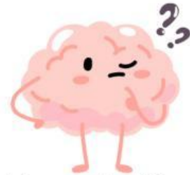
Formulación de una pregunta