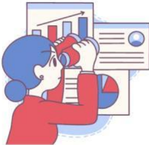
Análisis de resultados