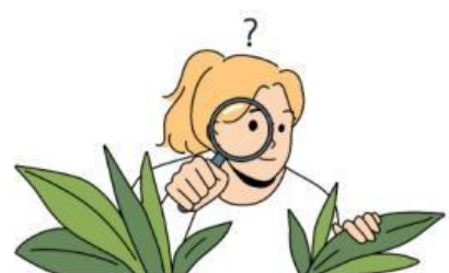
Observación de la naturaleza