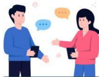
Comunicación de resultados