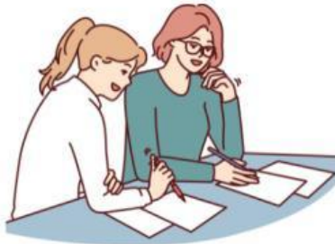
Elaboración de conclusiones