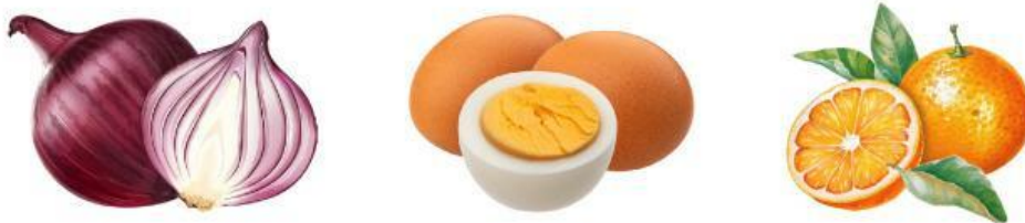
Gambar 1. Lapisan pada bawang merah, telur dan buah jeruk

Setiap benda memiliki struktur dan lapisannya masing-masing. Misalnya pada bawang merah, telur, dan buah jeruk yang ditunjukkan pada gambar berikut :