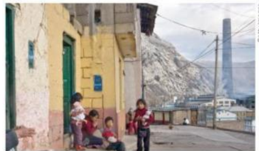
Niños de La Oroya cerca de una planta metalúrgica.

• ¿Qué tipo de transformaciones ha sufrido cada paisaje? ¿Qué impacto tienen estas transformaciones en los espacios que ocupan?