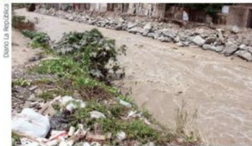
Basura en las riberas del río Chillón.

1 Observa las siguientes imágenes y respondan en parejas.