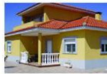
Casa Mirador (Carboneras, Cuenca)

Esta casa está en una de las calles más tranquilas del pueblo y a diez minutos del centro. Tiene tres dormitorios, un salón grande con sofá cama, cocina, dos baños, jardín y dos piscinas, una de ellas pequeña para niños.