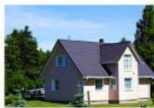
Casa La Pastora (Uncastillo, Zaragoza)

Información: Casa de dos plantas. Especial para grupos hasta 25 personas. Diez dormitorios con dos y tres camas. Baños en las habitaciones. Cocina y salón grandes. Wifi, calefacción. Jardín grande. Alquiler mínimo: 2 noches.