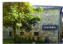
Casa Marcela (Brovales, Badajoz)

A dos kilómetros de un parque natural. Tiene cuatro habitaciones con baño, televisión y wifi, salón comedor y una cocina grande. Aparcamiento para un coche.