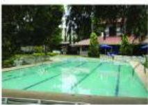
Casa Marcos (Albarracín, Teruel)

Está a tres kilómetros del pueblo. Tiene dos plantas, cuatro dormitorios, dos baños, una cocina, un salón con terraza y una piscina. Calefacción de gas.