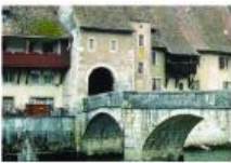
Casa El Rincón (Asturias)

Es una casa nueva que está al lado del río Sella. Tiene 3.000 m 2 de jardín, 4 habitaciones, 4 baños, salón y una gran cocina.