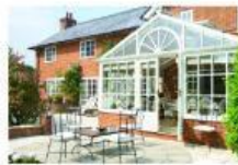
Casa Soler (Llacuna, Barcelona)

Es una casa nueva con cinco habitaciones, tres baños, dos terrazas y un jardín muy bonito con árboles frutales. Especial para grupos pequeños.