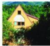
Casa Montañesa (Aguilar de Campó, Palencia)

Está en la montaña, Es una casa grande. Tiene siete habitaciones con baño, 2 cocinas y dos salones. Se alquila por días y por meses.