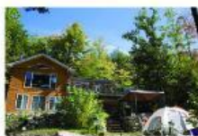
Casa El Castañar (Aracena, Huelva)

Al lado de un parque natural. Es una casa grande: cinco habitaciones con baño, dos cocinas, un salón, jardín de 1.000m 2 . Tiene un garaje para varios coches. Wifi.