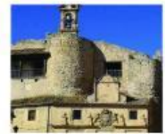
Casa La Muralla (Sepúlveda, Segovia)

La casa está en el centro del pueblo, al lado del castillo y de la iglesia Románica. Tiene tres habitaciones, dos baños y un jardín interior. Un lugar perfecto para una familia pequeña.