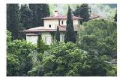
Casa Olazábal (Oíartzun, Guipúzcoa)

Está en la parte alta de la montaña. A pocos minutos de la playa. Tiene tres habitaciones dobles, una biblioteca, dos baños, cocina y salón con una gran terraza.