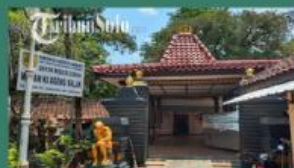
Wisata Makam Balakan

Wisata royal water adventure Royal Water Adventure menyediakan wisata air dengan berbagai wahana menarik bagi keluarga. Banyak pengunjung yang memilih untuk berlibur disini. Suasana yang ceria dengan konsep kolam renang dengan berwarna warni menjadi favorit bagi anak. Wisata The Heritage Palace merupakan pabrik gula peninggalan kolonial Belanda bisa disulap menjadi obyek wisata menarik. obyek wisata bertema gedung ala Eropa klasik dengan beragam spot foto Instagram-able. Lokasinya berada di Jalan Permata Raya Dukuh Tegal Mulyo Rt. 002 Rw. 008, Honggobayan, Pabelan, Kecamatan Kartasura, Kabupaten Sukoharjo.