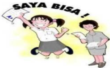
Gambar 1.1 Siswa yang Berhasil dalam ujian