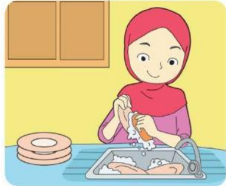
Gambar 1.4