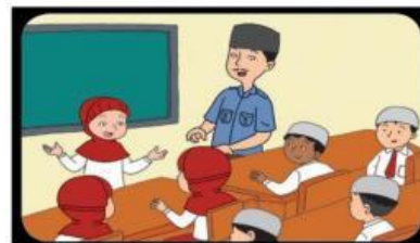
Gambar 1.2 siswa yang berani tampil