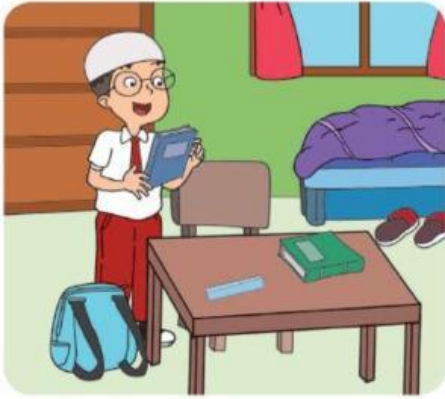
Gambar 1.3