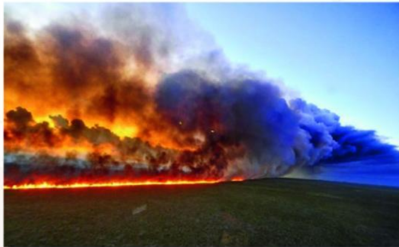
Gambar 1. Kebakaran Hutan Amazon