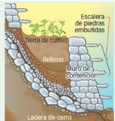
Estructura interna de un andén incaico.

Hoy es posible encontrar estas construcciones en los alrededores de los centros arqueológicos incaicos y en pueblos que los siguen utilizando como medio de producción agrícola.