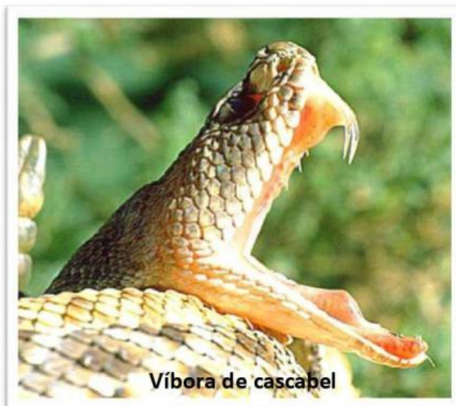
Víbora de cascabel