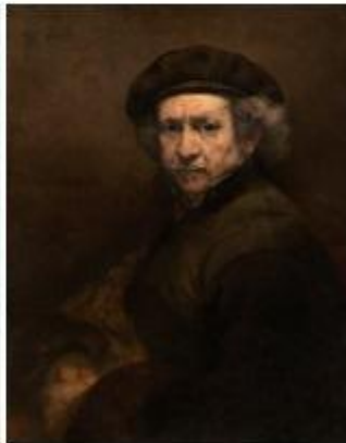
Rembrandt van Rijn