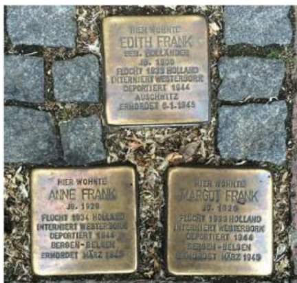
„Stolpersteine“ für die Franks dort, wo sie in Aachen gewohnt hatten

2. Lies die Stolpersteine. Wie war Annes Familie? Was ist mit ihnen passiert?