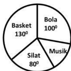
Data Hobi Siswa

Diketahui sekolah SMP A memiliki total siswa 1.260 siswa. Berapa siswa yang mempunyai hobi musik?