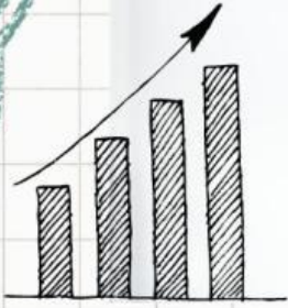
Banyaknya pembakaran kalori berdasarkan jenis aktivitas olahraga

Menafsirkan data dalam bentuk diagram batang