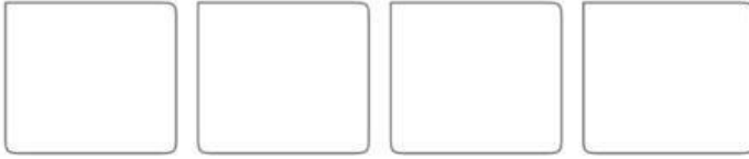
Waning moon Full moon Waxing moon New moon