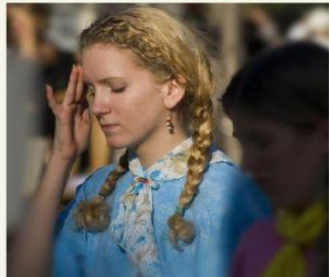
La chica tiene dolor de cabeza