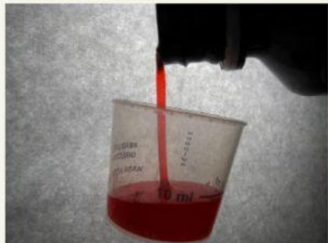
El jarabe para la tos