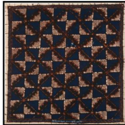
b. Batik Slobog

Dari kedua batik di atas, apakah kamu bisa menemukan dan menggambarkan kedudukan dua garis di buku tulismu? Ayo coba tuliskan kedudukan dua garis yang kamu temukan dan berikan alasan kamu mengapa menggambar garis tersebut!