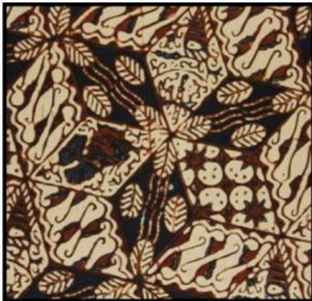
a. Batik Tambal

Batik Slobog adalah salah satu motif batik Jawa yang memiliki desain yang mirip dengan motif batik tambal dan memiliki pola dasar geometris. Slobog memiliki isian ragam hias yang konsisten dan berulang dengan sama hingga kain selesai.