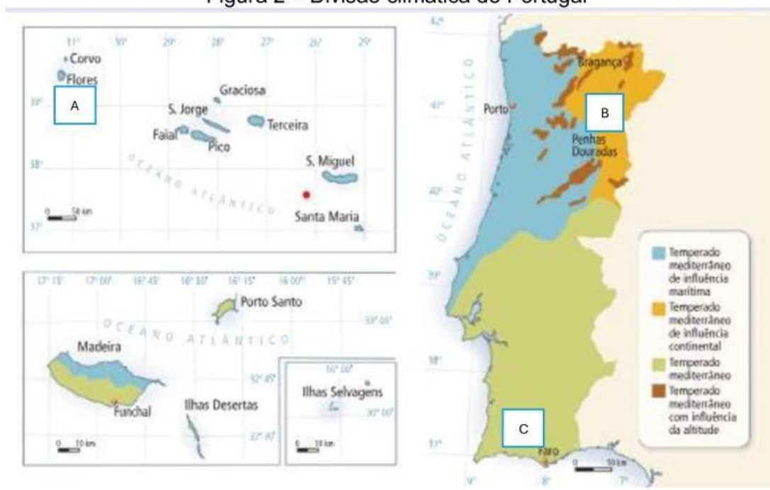
Figura 2 – Divisão climática de Portugal

Mapa de base in Geo.pt, 10, Areal Editores