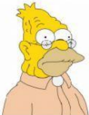
der Großvater der Opa

Wir lieben unsere Enkelkinder! Ich bin Edwina und mein Mann heißt Abe. Wir sind die Stiefeltern von Homer.