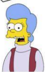
die Großmutter die Oma