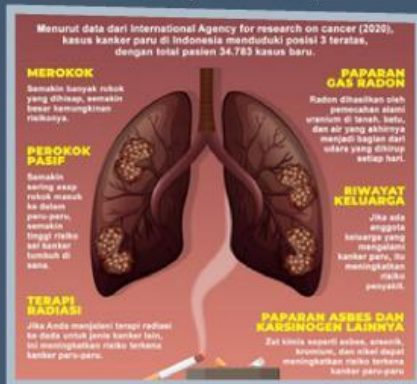
Gambar 4. Faktor Risiko Kanker Paru