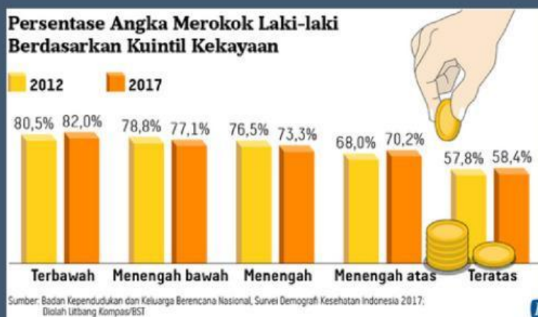
Gambar 1. Grafik Perokok Laki - Laki