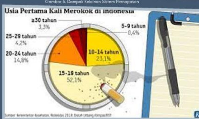
Gambar 5. Persentase Perokok Aktif Berdasarkan Usia