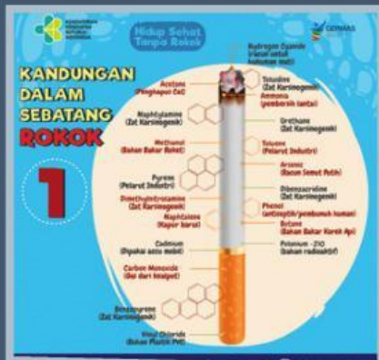
Gambar 2. Kandungan dalam Sebatang Rokok