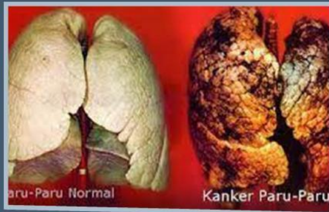
Gambar 3. Dampak Kelainan Sistem Pernapasan