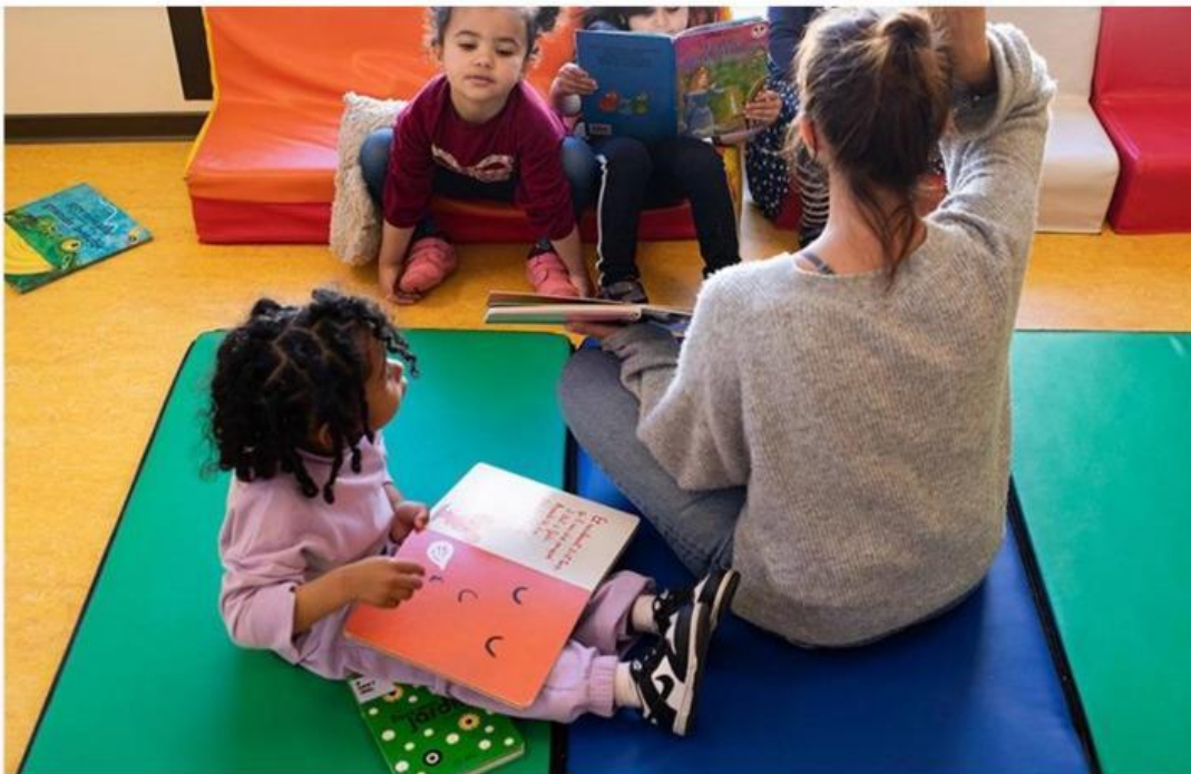
Moments de plaisir et de douceur partagés autour d'un livre dans une crèche d'Auteuil Petite Enfance (APE).

C'est la dernière étude d'ampleur menée pour mesurer l'appétence des jeunes de 7 à 25 ans pour la lecture. Les résultats de l'enquête 2022 du Centre national du livre (CNL) confirment qu'ils sont encore nombreux à lire : 81 % des 7-25 ans lisent pour leurs loisirs, « par goût personnel ». Concernant leurs choix, les 7-19 ans « lisent plus qu'avant des BD, mangas, comics (73%), quand les 20-25 ans privilégient encore les romans (58%) ».