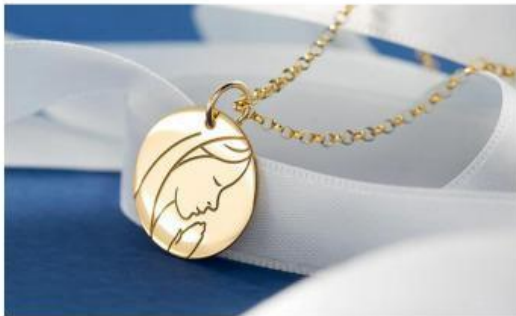
Símbolo que se recibe en la primera comunión