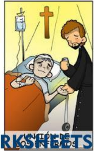
UNIÓN DE LOS ENFERMOS