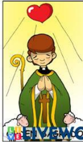
UNIÓN DE LOS ENFERMOS