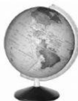
(B) GLOBO TERRESTRE

( ) É uma representação esférica da terra em tamanho reduzido.