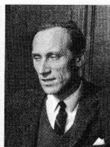
Leszek Kołakowski, ur. w 1927 roku w Radomiu, zm. w 2009 roku w Oksfordzie, polski filozof zajmujący się głównie historią filozofii, historią idei oraz filozofią religii, eseista, publicysta i prozaik. na podstawie: Leszek Kołakowski , www.wikipedia.org