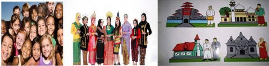
Gambar 3. a