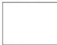
Una cartulina blanca