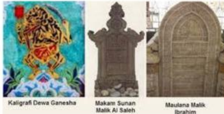
Kaligrafi Dewa Ganesha Makam Sunan Malik Al Saleh Maulana Malik Ibrahim

Perhatikan gambar dibawah ini sesuai urutan gambar untuk No. 19, 20, 21, 22 ! Tariklah jawaban pada gambar benda kriya sesuai dengan masa perkembangannya!