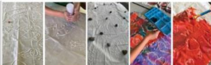
Gambar 3.2. Kegiatan membuat batik dengan alternatif media lem kayu