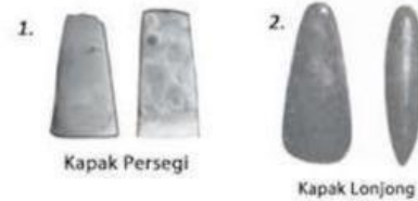
1. Kapak Persegi 2. Kapak Lonjong