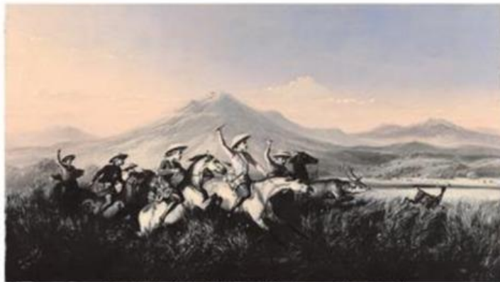
Gambar lukisan Raden Saleh berjudul "Six Horsemen Chasing Deer"/ "Enam Penunggang Kuda Mengejar Seekor Rusa (1860)

buat dalam bentuk apresiasi tertulis, menulis kritik seni berdasarkan langkah proses apresiasi analisis formal!