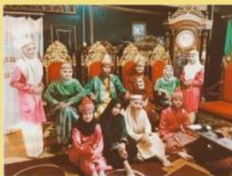
Gambar 2. Teater Dulmuluk

Dari gambar disamping, ada beberapa tokoh yang memerankan berbagai karakter pada lakon “Cari Orang Pintar” salah satunya yaitu karakter ratu. Apabila pertunjukan selanjutnya berlangsung, berapa kemungkinan tokoh perempuan yang lain berkesempatan memerankan karakter ratu?