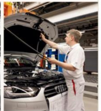
Arbeit im Motorraum heute

Arbeiter und Angestellte bei Audi haben heute 40 mehr bezahlten Urlaub und eine kürzere Wochenarbeitszeit als früher. „Es hat sich wirk-