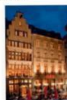
Brauhaus – traditionell