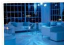
Club – schick