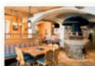
Restaurant – deutsch