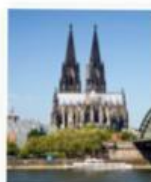
Dom – berühmt

Was gefällt Ihnen? das alte Rathaus, ... Was finden Sie uninteressant? den berühmten Dom Wo sind Sie am Abend? in dem schicken Club