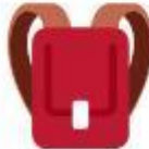
LE SAC À DOS