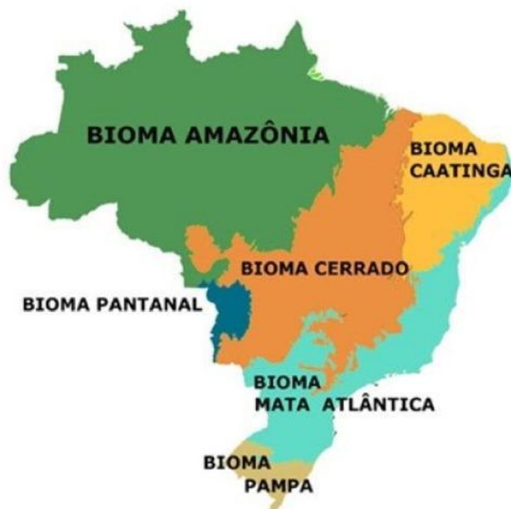
MAPA DOS BIOMAS BRASILEIROS