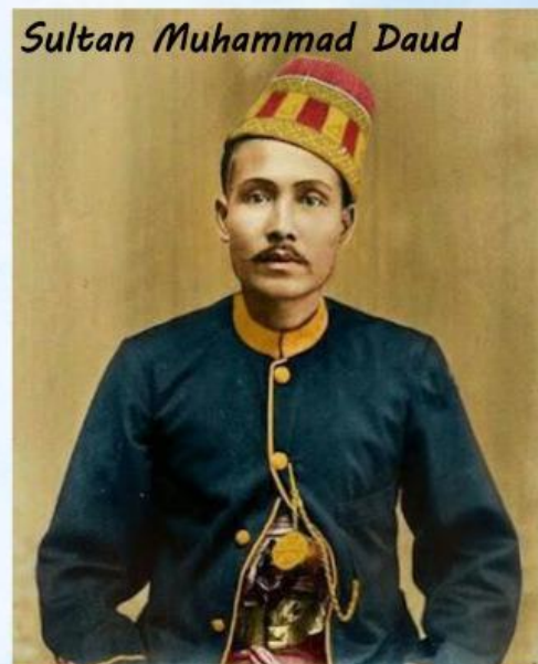
Sultan Muhammad Daud