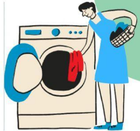
Le lave-linge (washing machine)