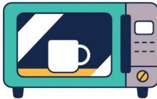
Le micro-onde (Microwave)