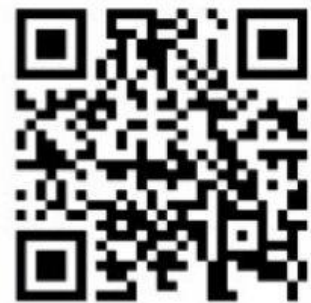
Kenapa Sampai Sekarang Belum Ada Obat HIV/Aids?