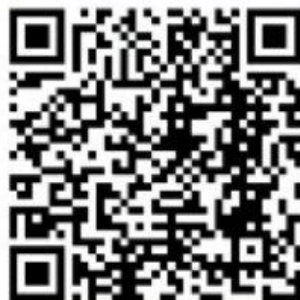
Mengenal Ragam penyakit autoimun