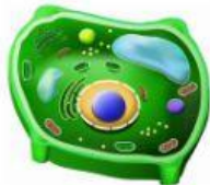
CÉLULA EUCARIOTA ANIMAL