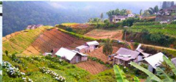
Lahan Sawah di Kota Batu