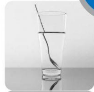
Gambar 4. Set Pecobaan Pembiasan