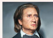
Franz Liszt ✓ ✗

3 Relaciona cada compositor con su nombre correspondiente