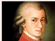
Bach ✓ ✗