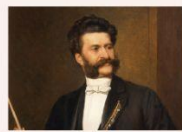
Strauss ✓ ✗