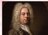
Haydn ✓ ✗

2 Indica si las siguientes afirmaciones son verdaderas o falsas