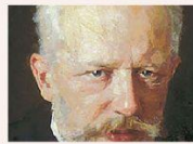
Tchaikovsky ✓ ✗