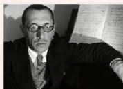
Schoenberg ✓ ✗