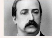
Borodín ✓ ✗