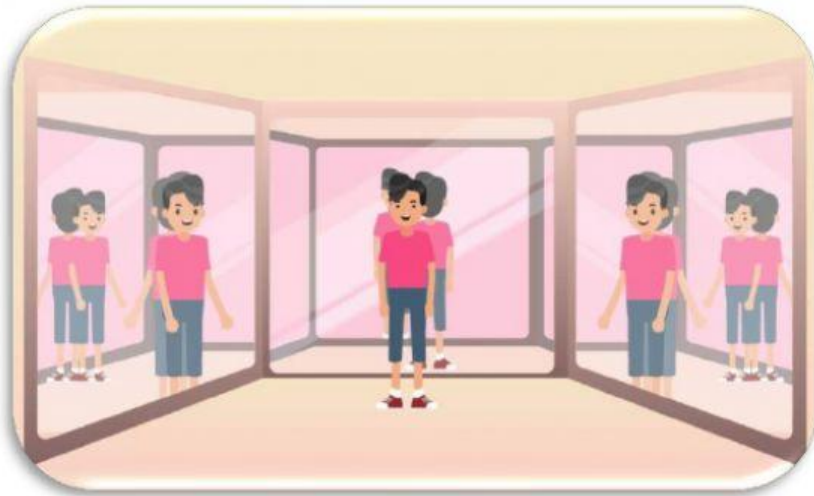
Gambar 5. Seseorang yang sedang bercermin