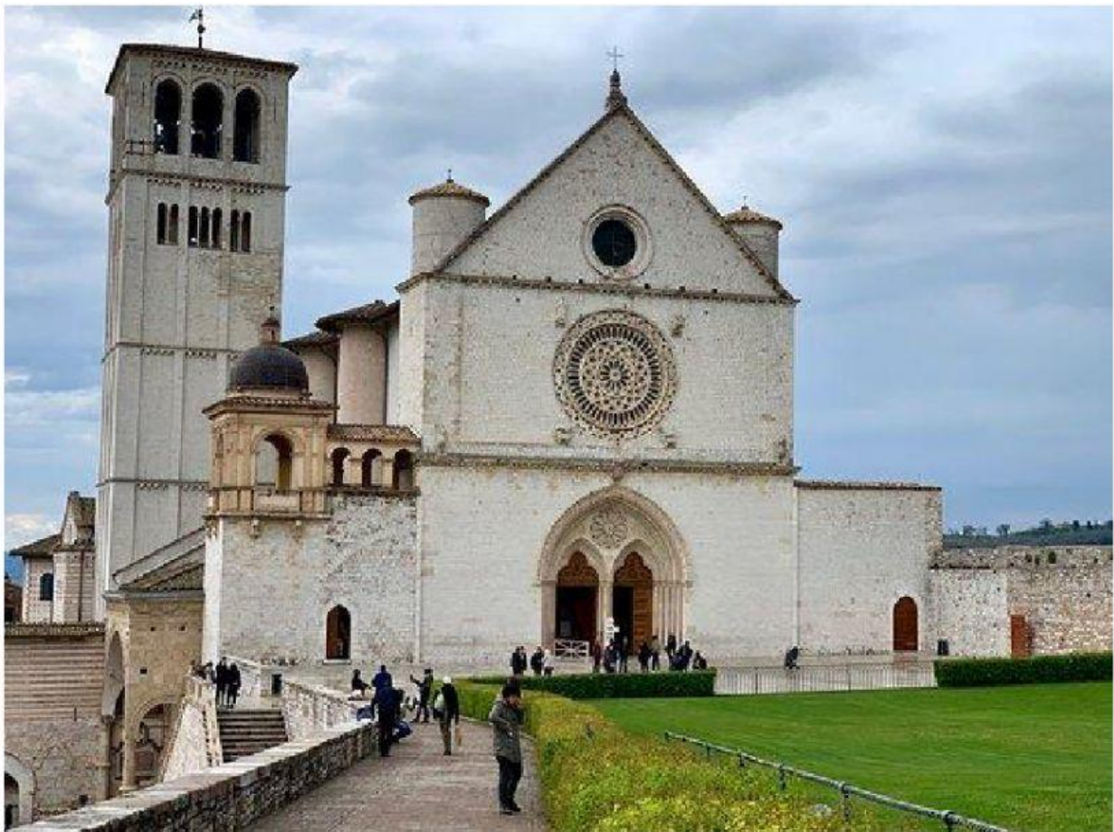
La Basilica Superiore di San Francesco ad Assisi