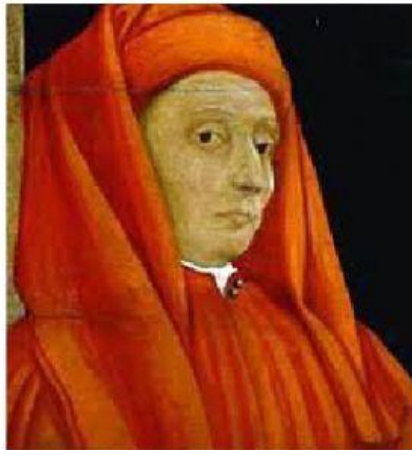
Ritratto di Giotto