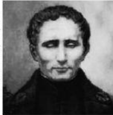
מִנְיָן וִיקִיפֶּדְיָה הַעִבְרִית