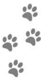
Huellas de gato