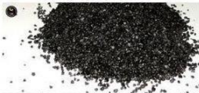
HISTORIA DE LA POLVORA

Relaciona con una línea la civilización con el invento que realizó cada una de ellas.