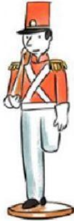
A. El soldadito.

1.- ¿Cuál era el juguete preferido de los niños?