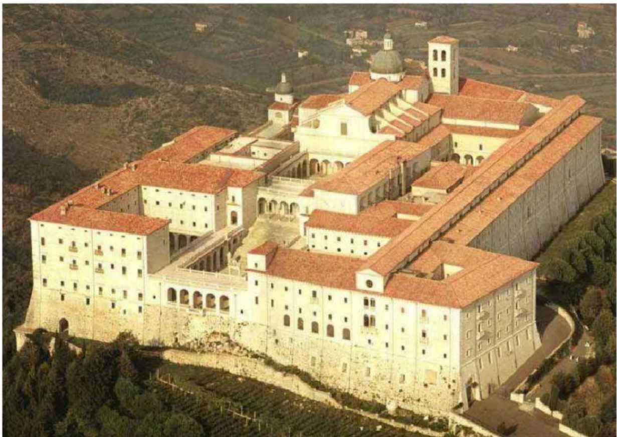
Monastero di Montecassino

Il monastero, di solito, era un edificio composto da: