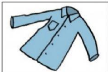
a. une chemise (en tissu)