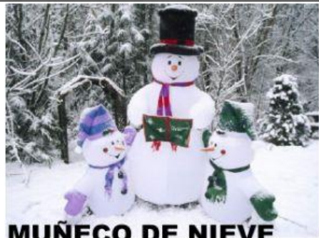
MUÑECO DE NIEVE

CON NIEVE SE HACE EL SOL LO DESHACE UN SOMBRERO LE TAPA SU CABEZA HELADA NARIZ DE ZANAHORIA BUFANDA DE COLOR ¿ADIVINAS DE QUIÉN HABLO YO?