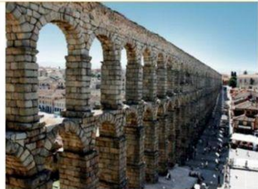
Acueducto de Segovia.