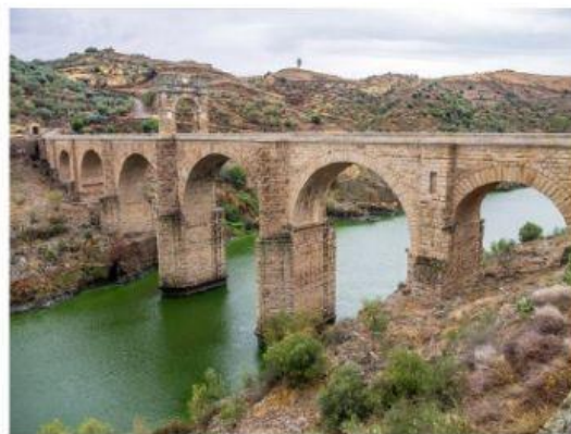
Puente romano San Pedro de Alcántara