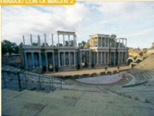
Teatro de Mérida.