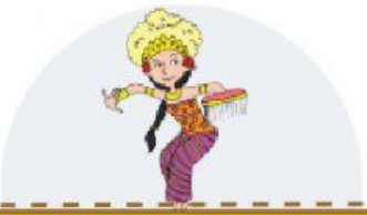
Dayu menari Bali