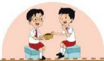
Udin berbagi kue