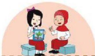
Lani menggambar bunga

5. Tulislah ungkapan pujian yang tepat pada gambar di bawah ini.